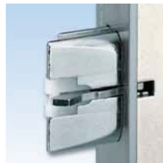
Automatikus többpontos lezárás: GU-SECURY Automatic – a kattató zár

Kösse össze a biztonságot a kényelemmel! A Gretsch-Unitas mechanikusan önreteszelő zárrendszerei kiváltják a kulccsal történő kézi zárást. Mindegy, hogy tűzgtátlásról, pánik- vagy privát lakótérről van szó, ezek a rendszerek minden alkalmazási területen kényelmes megoldást kínálnak.