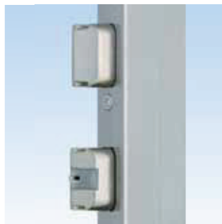
Kiegészítő zárnyelv ▼